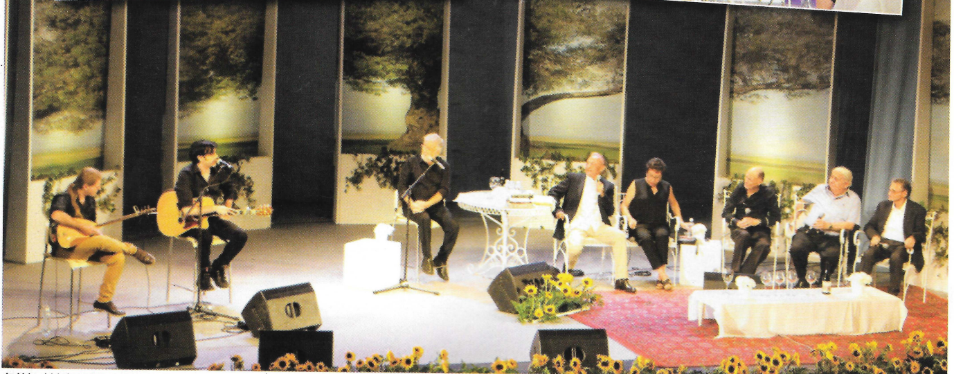
מתוך פסטיבל מספרי סיפורים - מימין - עם השרה לשוויון חברתי גילה גמליאל ומשמאל עם שר התחבורה ישראל כץ ומנכ"ל חברת "דן" עופר זלביגר.