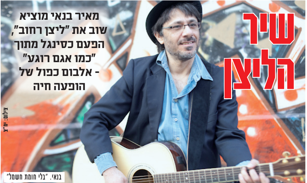
בנאי. "בלי חמת חשמל"

אותה ביקש להנציח על גבי אלבום כפול. בנאי: "הרבה שנים לא הופעתי כך והשינוי לפני הכול, אתגר וריגש אותי. היה בי רצון להיות לבר מול הקהל, בלי חומת חשמל, תופים והגברה כבדה. חשוף עם כל הטעויות, אבל מצד שני קרוב מאוד לאנשים שבאים לשמוע את המוזיקה. השירים לא תמיד מברזעים כפי שכתבתי אותם. הם קיבלו את צורתם מחדש, כשירים חשופים על במה מול קהל. זה דרש מהם להשתנות קצת, גם זה היה תהליך מעניין".